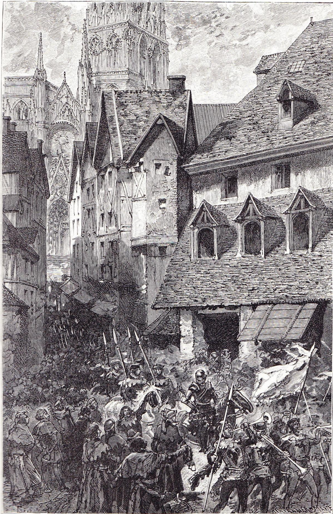
IL CHEVAUCHA TANT EN CETTE JOURNÉE QU'IL ENTRA DANS LE DUCHÉ (CHAP. XXXVIII)